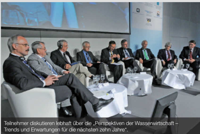
Teilnehmer diskutieren lebhaft über die „Perspektiven der Wasserwirtschaft – Trends und Erwartungen für die nächsten zehn Jahre“.