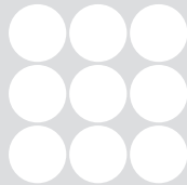
Prüfung und Zertifizierung