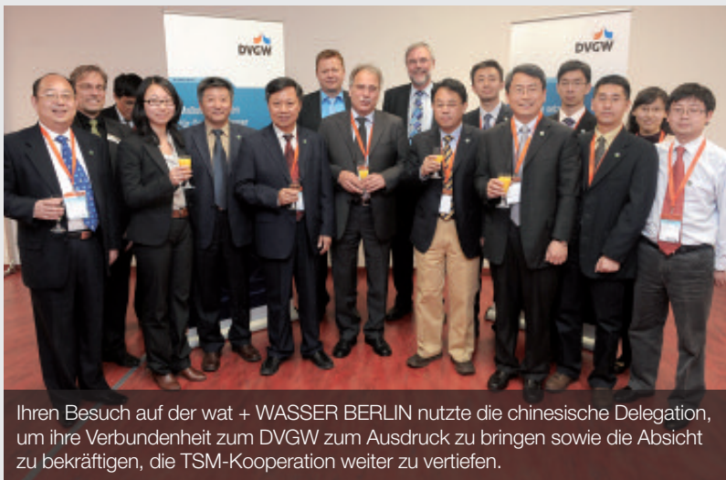
Ihren Besuch auf der wat + WASSER BERLIN nutzte die chinesische Delegation, um ihre Verbundenheit zum DVGW zum Ausdruck zu bringen sowie die Absicht zu bekräftigen, die TSM-Kooperation weiter zu vertiefen.

Der DVGW vereinbarte auf der WASSER BERLIN INTERNATIONAL eine Intensivierung der Zusammenarbeit mit der CUWA, der China Urban Water Association. Im Kern steht dabei das Technische Sicherheitsmanagement, kurz TSM. Bereits in der Vergangenheit haben beide Verbände eng zusammengearbeitet und sich gegenseitig über neue Entwicklungen informiert. Künftig soll nun das TSM in China zu einem ganz wichtigen Baustein bei der weiteren Verbesserung der Trinkwasserversorgung werden. Dabei bringt China eigenes Know-how und eigene Leistungen ein, um das TSM optimal auf die Bedürfnisse des Landes anzupassen. Zentrale Aspekte sind Versorgungssicherheit und Effizienz.