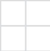
Regelsetzung und Normung