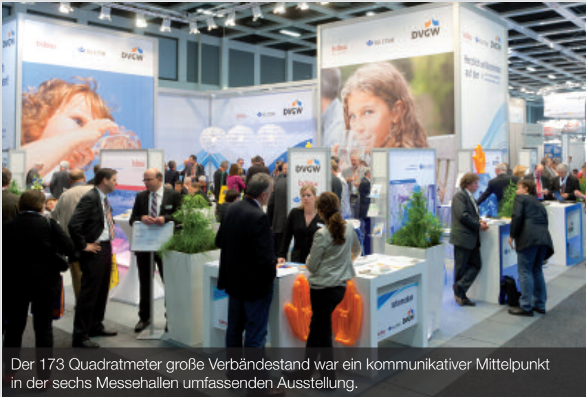
Der 173 Quadratmeter große Verbändestand war ein kommunikativer Mittelpunkt in der sechs Messehallen umfassenden Ausstellung.